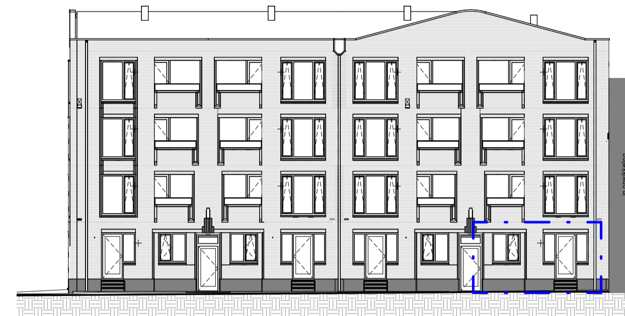
Voorgevel 1 : 200