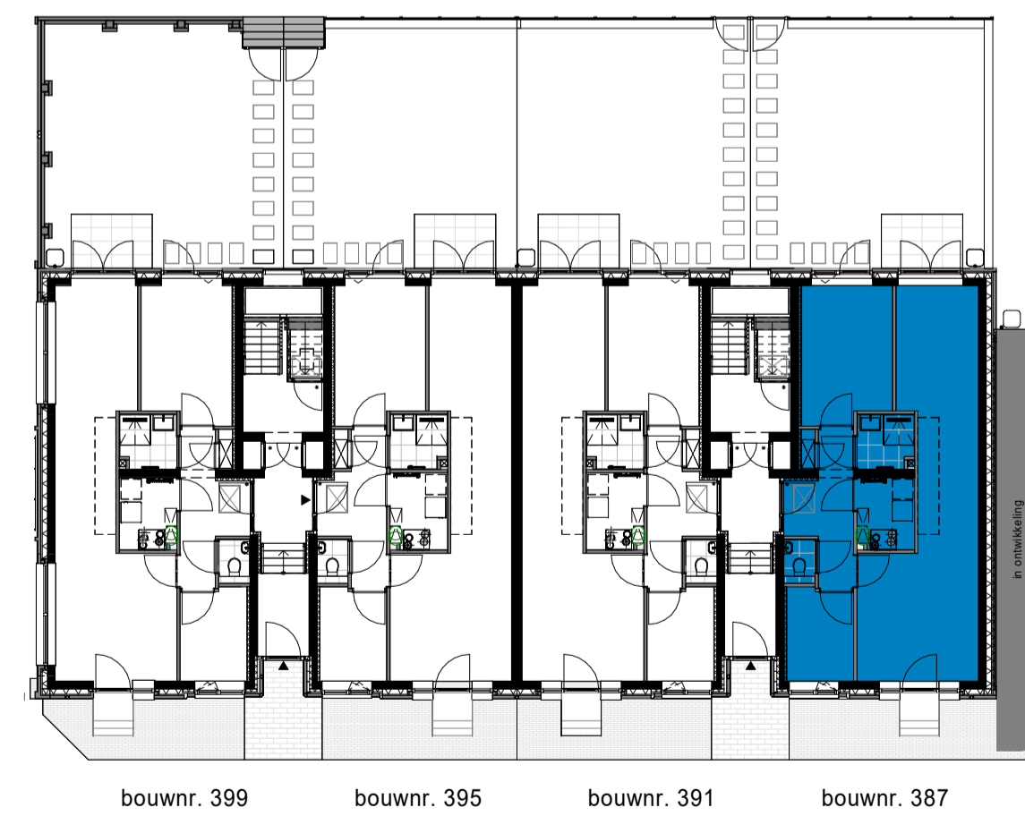
begane grond D1 Appartementen 1 : 200