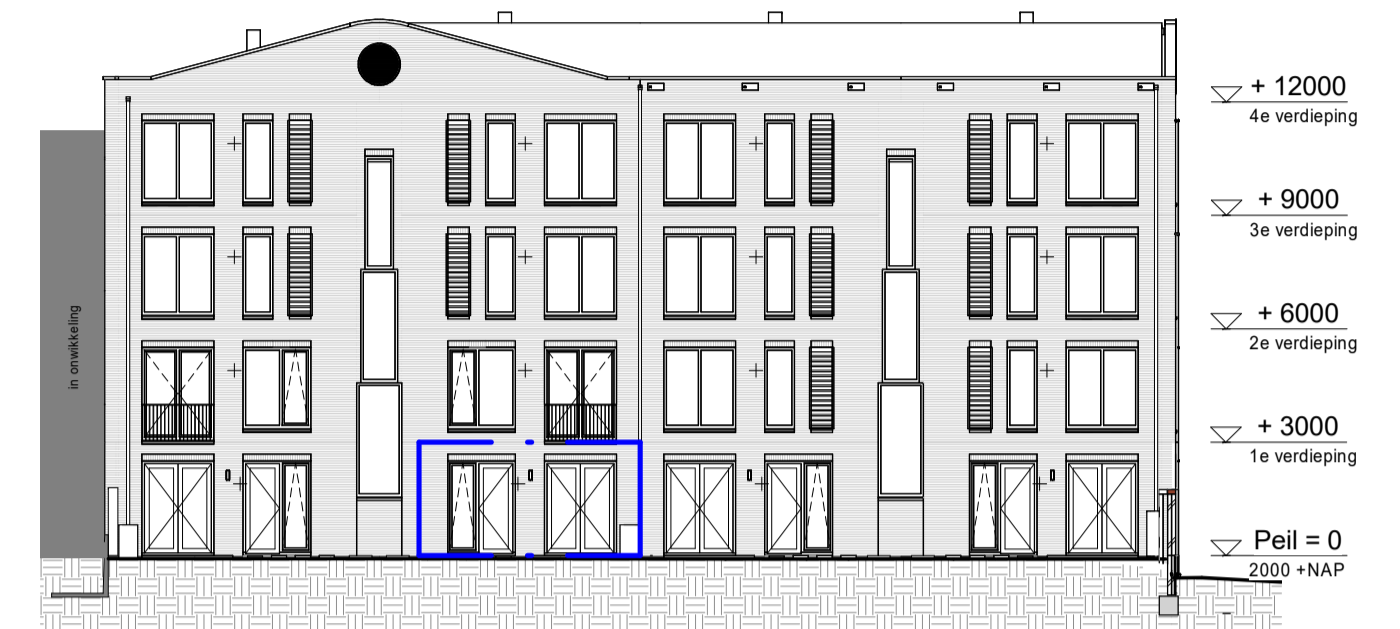
Achtergevel 1 : 200