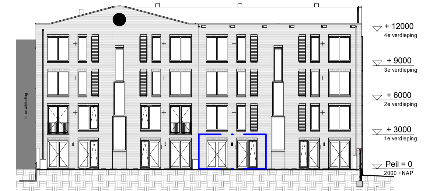
Achtergevel 1 : 200