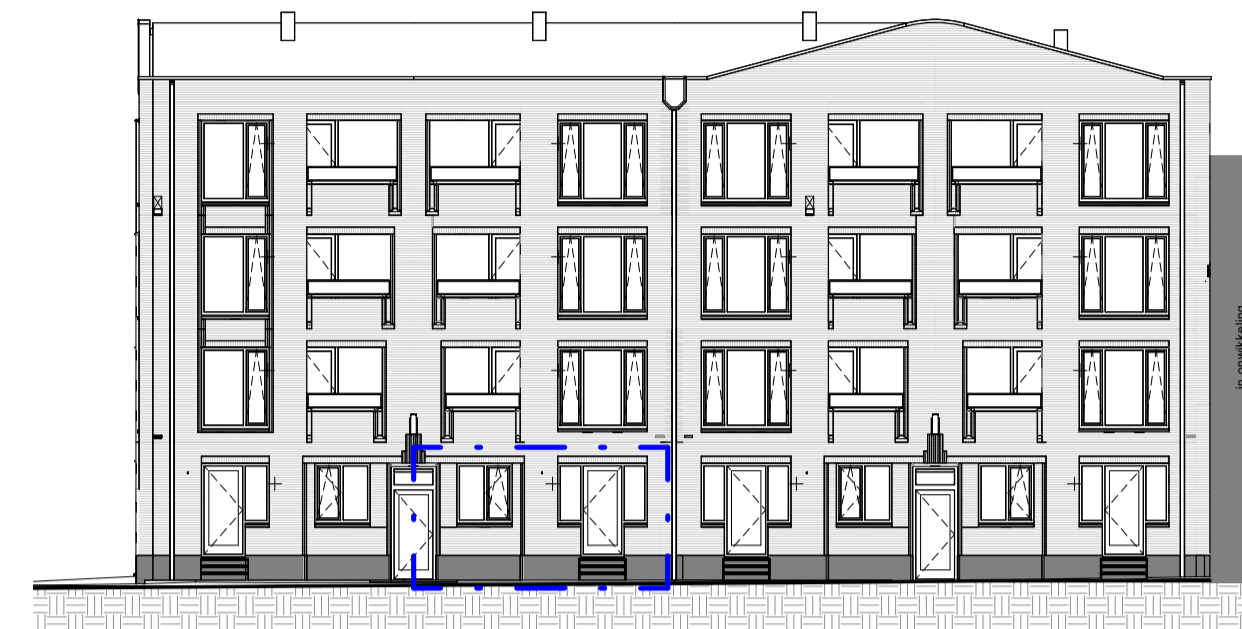
Voorgevel 1 : 200