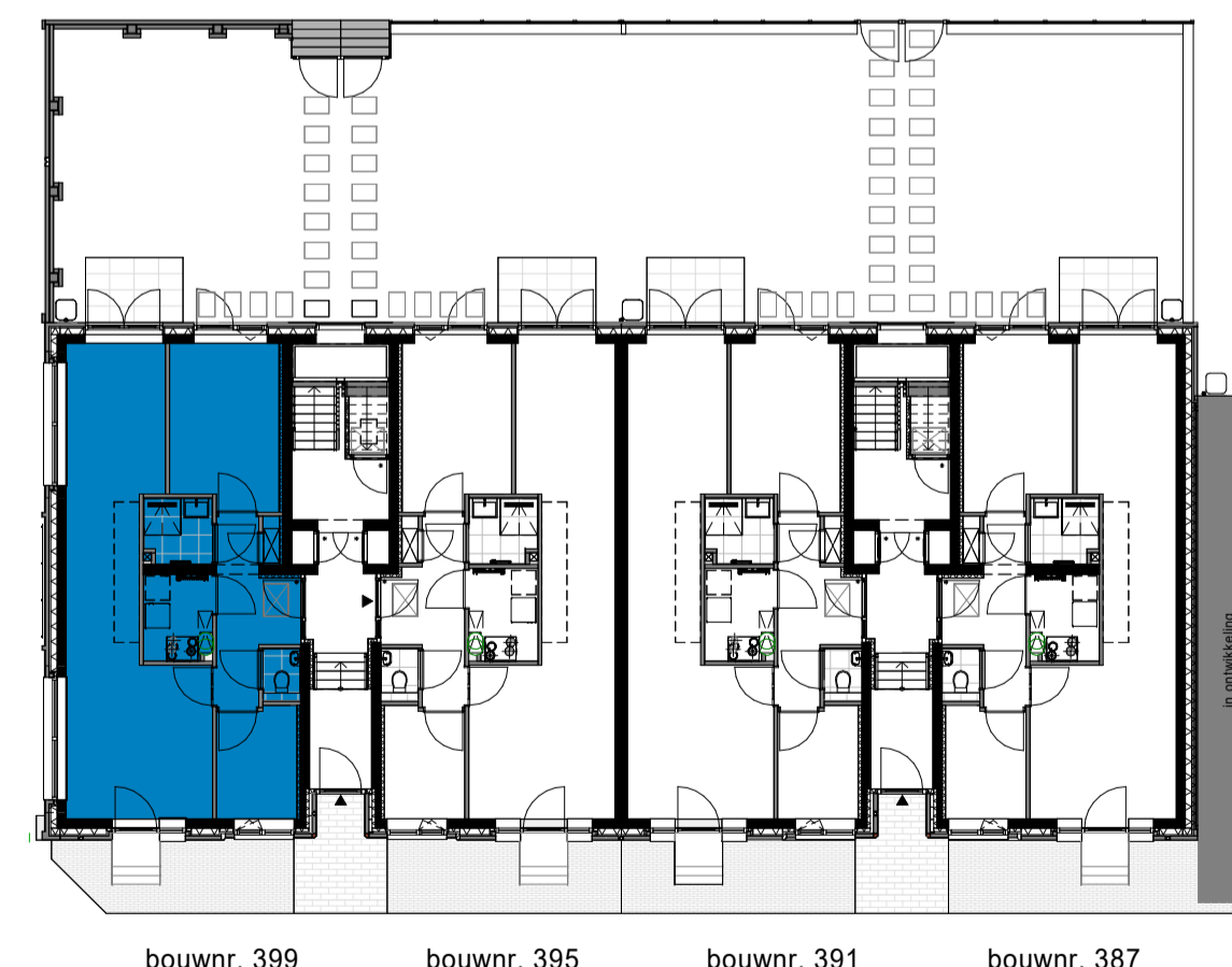
begane grond D1 Appartementen 1 : 200