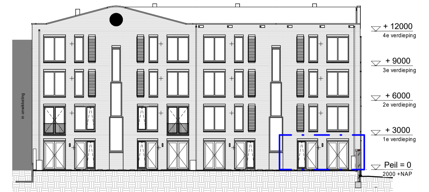
Achtergevel 1 : 200