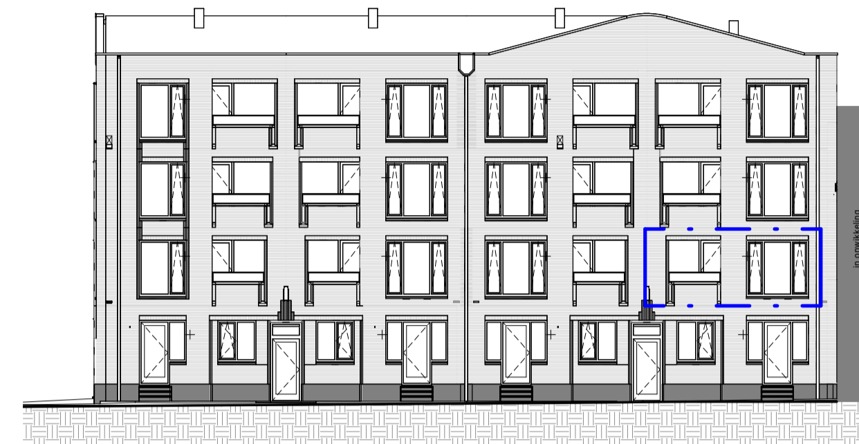
Voorgevel 1 : 200