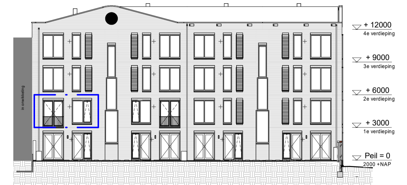
Achtergevel 1 : 200