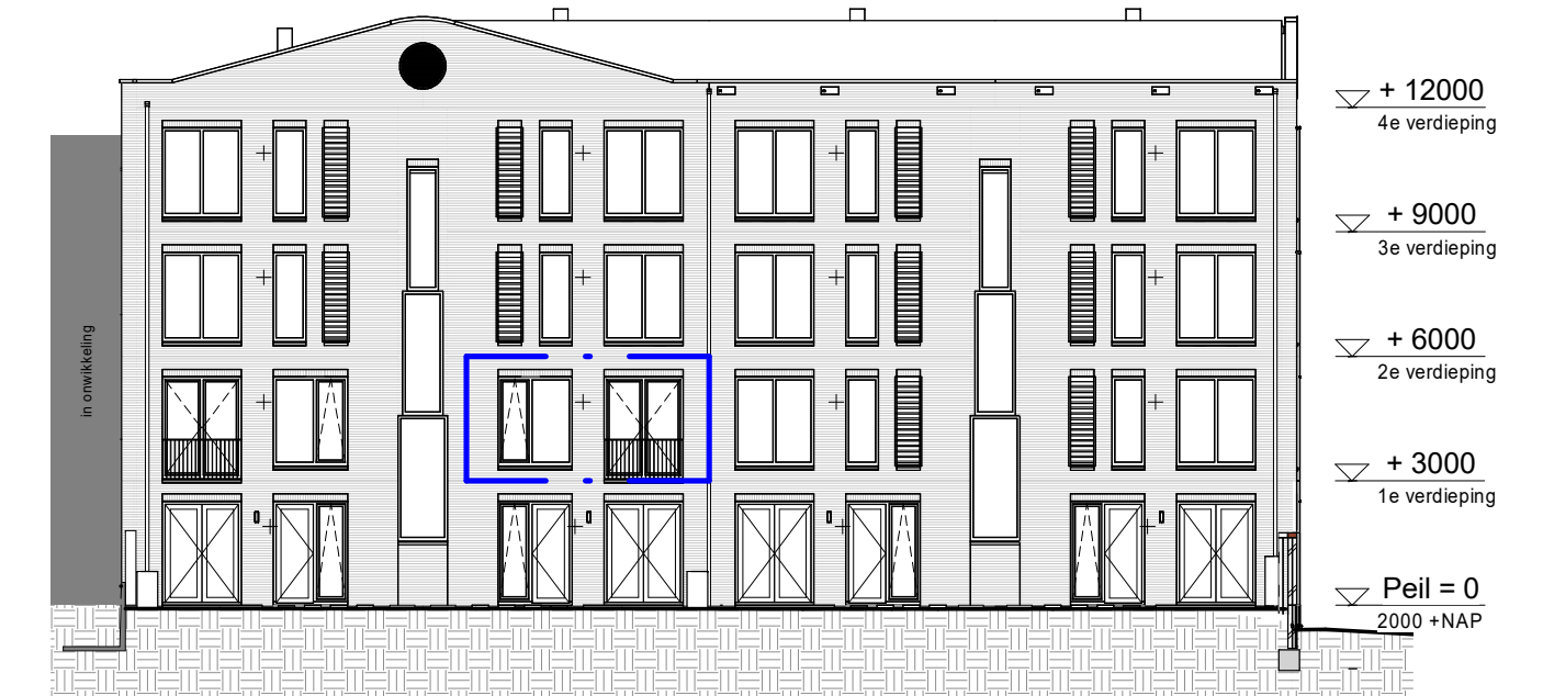
Achtergevel 1 : 200