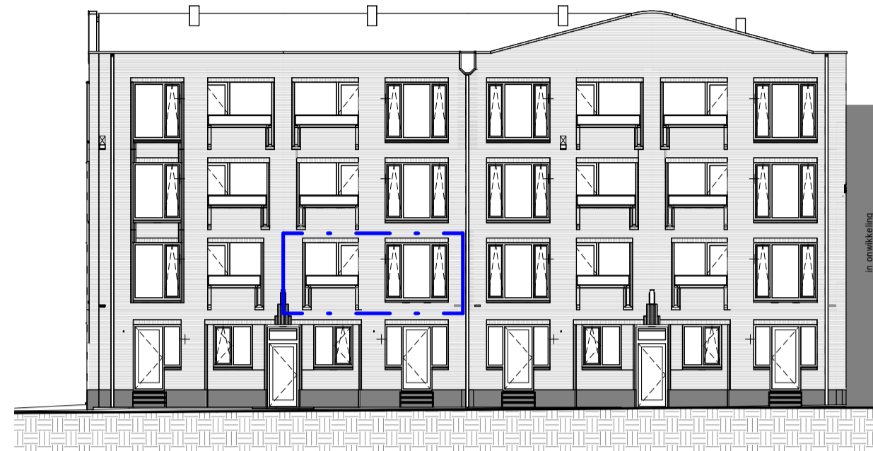
Vorgevel 1 : 200