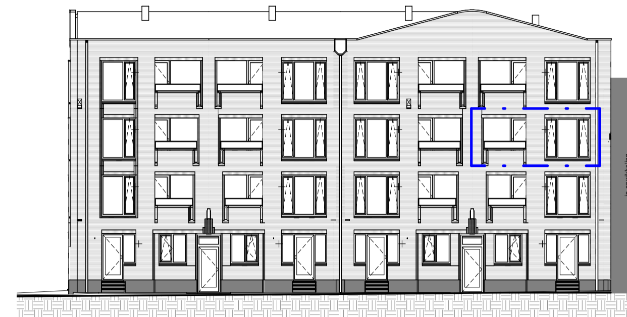
Voorgevel 1 : 200