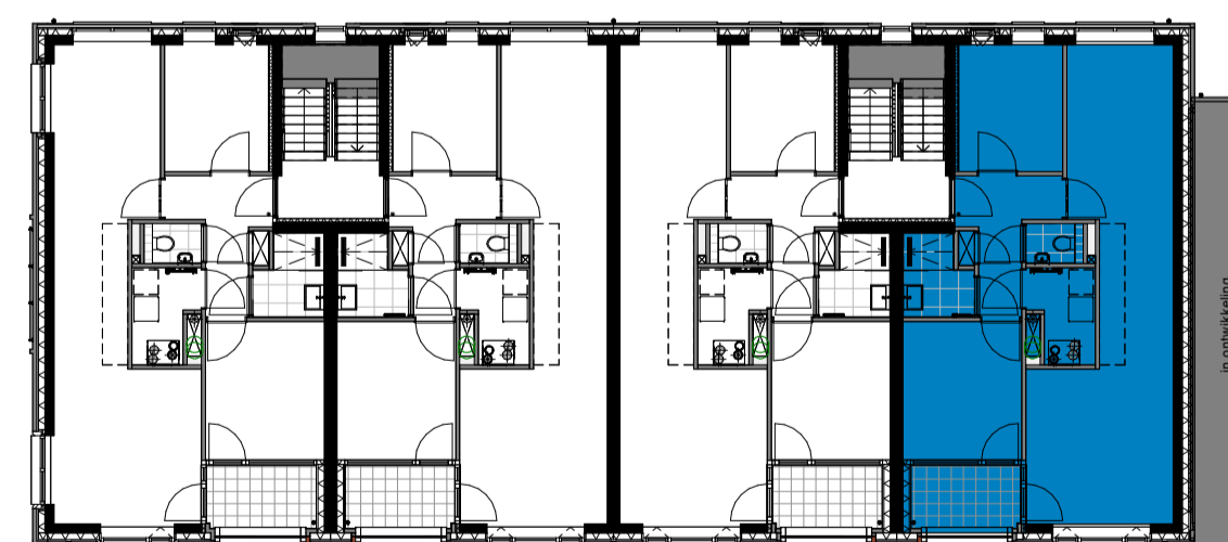
bouwnr. 401 bouwnr. 397 bouwnr. 393 bouwnr. 389