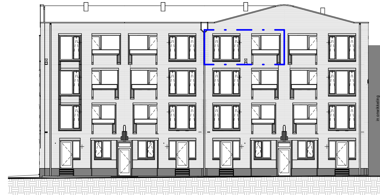
Voorgevel 1 : 200