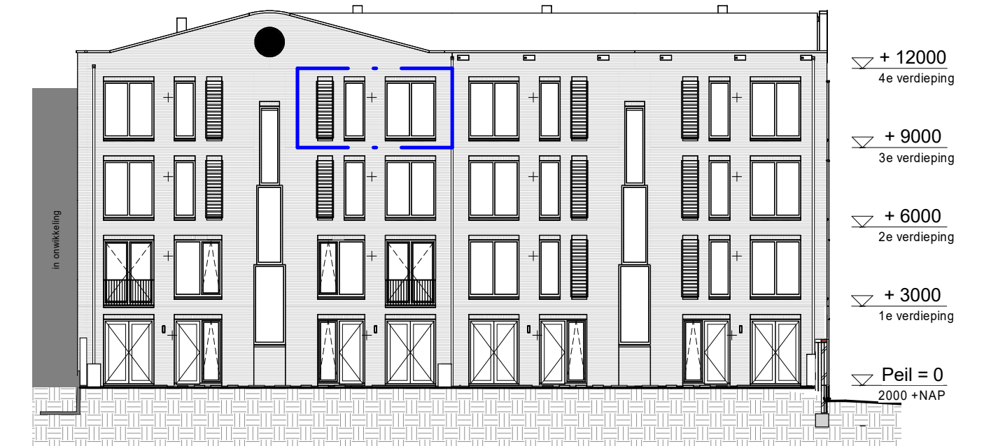
Achtergevel 1 : 200