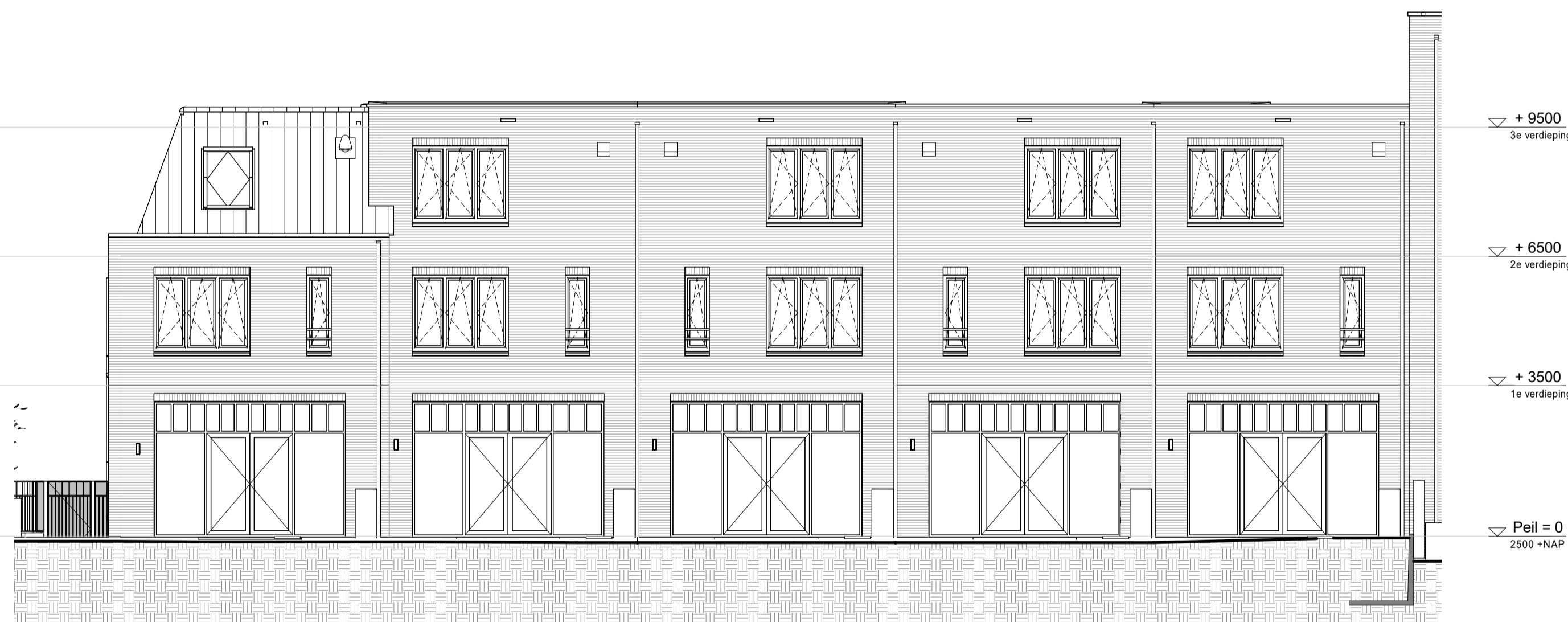
bouwnr. 381 bouwnr. 382 bouwnr. 383 bouwnr. 384 bouwnr. 385