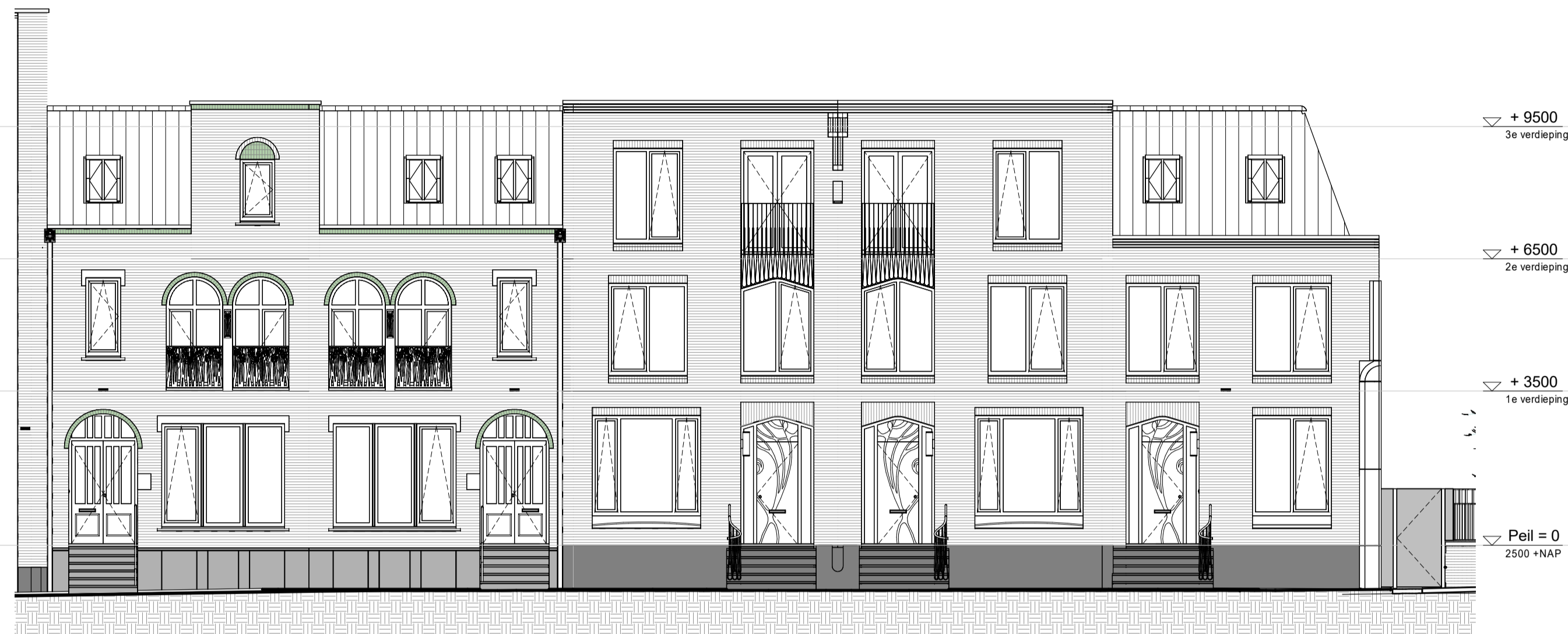
bouwnr. 385 bouwnr. 384 bouwnr. 383 bouwnr. 382 bouwnr. 381