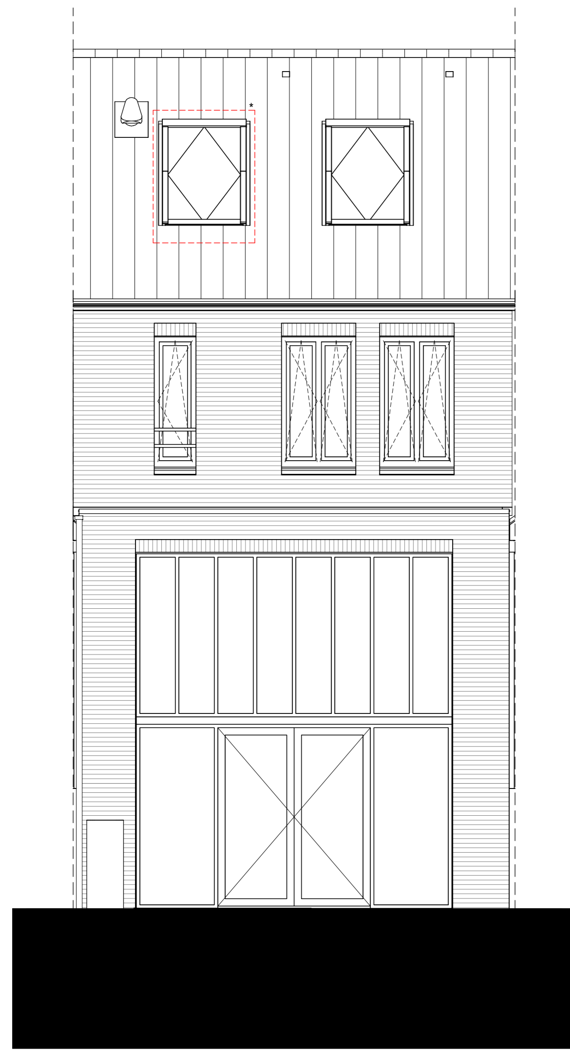
Achtergevel - Optie extra dakraam t.p.v. bovenste verdieping (bnr 373 t/m 377 en 380)