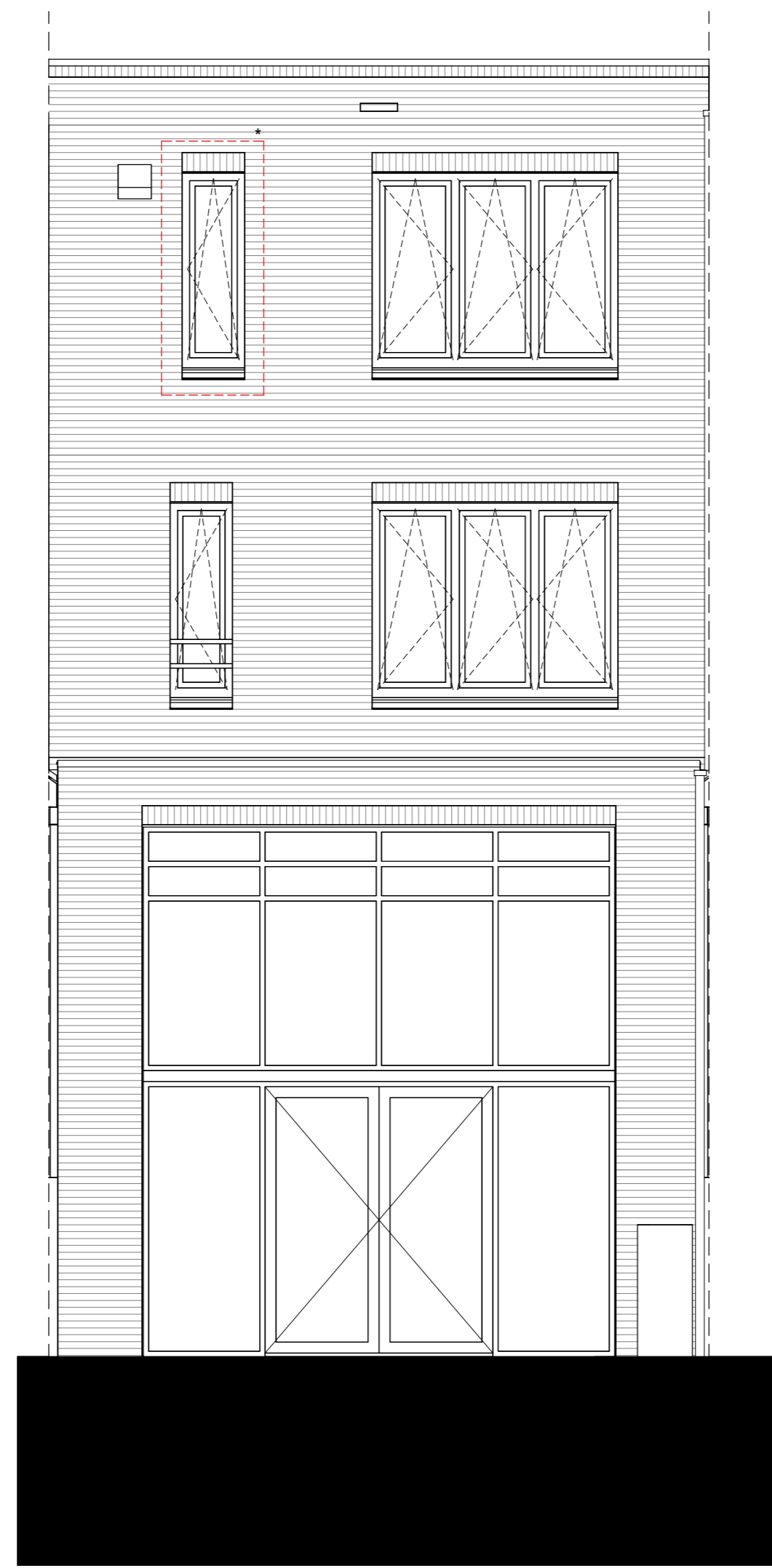
Achtergevel - Optie extra raam t.p.v. bovenste verdieping (bnr 372, 378 en 379)