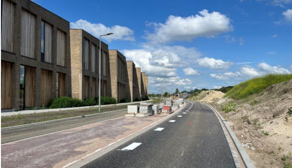
Werkzaamheden voor het afronden van de Verlegde Bosdreef. In de bedrijfsgebouwen aan de linkerkant is ook de Karwei gevestigd.

Het eerste deel van de Verlegde Bosdreef is bijna klaar. Dit begint bij de nieuwe verkeerslichten op de Bosdreef, bij de Stoomstichting. Over deze weg is inmiddels de nieuwe bouwmarkt Karwei te bereiken, die op 5 juni geopend is. Op dit bedrijventerrein is onder andere ook de opslagformule Safestore gevestigd.