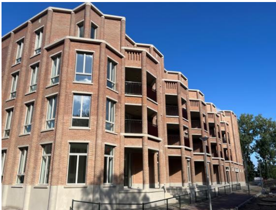
Appartementengebouw Op de kop van de Boezem

Eind juli wordt het gebouw met 50 huurappartementen opgeleverd en na de zomer zullen de bewoners er in trekken. Het gebouw beschikt over parkeren in het gebouw zelf en op de hoek komt een vestiging van pizzeria Old Scuola met een terras!