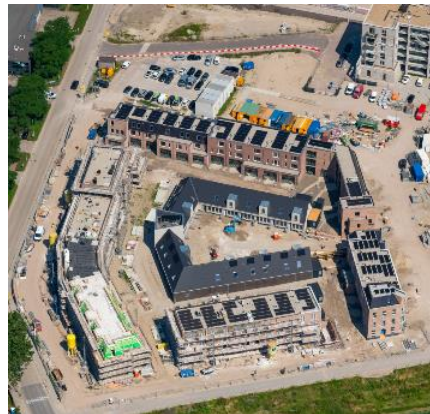
Luchtfoto van 'Op de kop van de Avenue I'